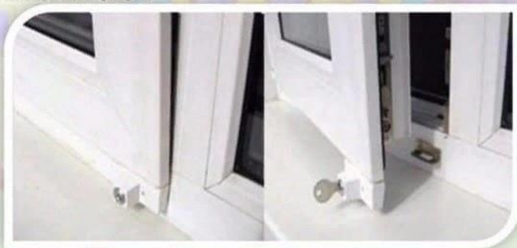
Замок блокировщик с ключом

Можно воспользоваться специальными замками блокираторами, которые предлагают установщики пластиковых окон.