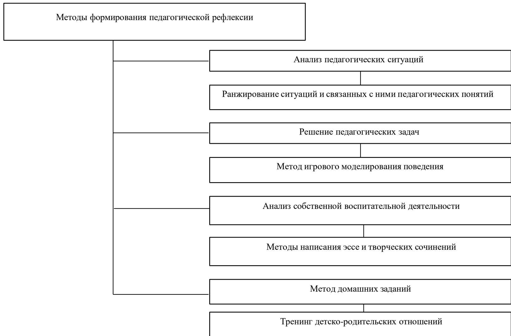
Схема. Методы формирования педагогической рефлексии