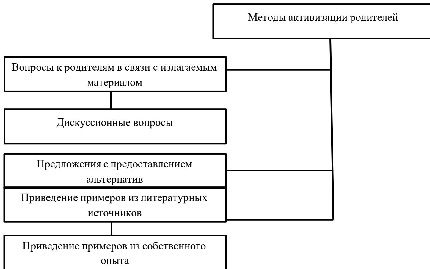
Схема. Методы активизации родителей

3 этап - формирование у родителей более полного образа ребенка и правильного его восприятия, включение родителей в образовательное пространство.